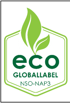
řekil 1: İki Renkli Etiket/Logo

3.13 Logo/Marka/Etiket örneđi ařađıda belirtildiđi gibidir.