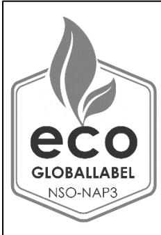
řekil 2: Siyah-Beyaz Etiket/Logo